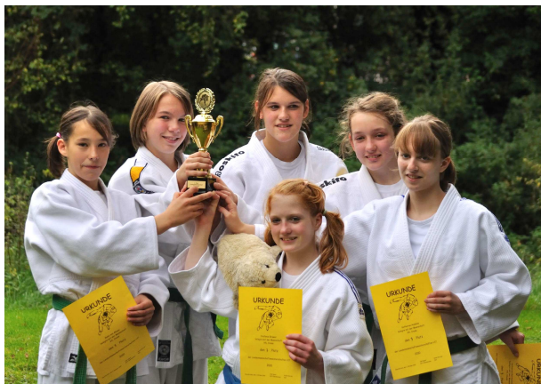
Unsere Mädchen U17 erringen einen tollen 3. Platz bei den Landesmeisterschaften.