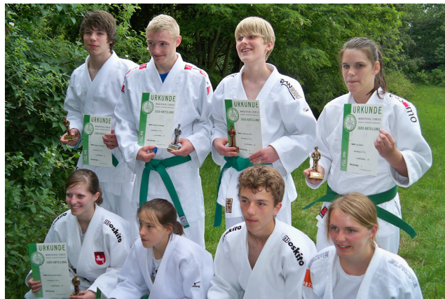
Unsere Gewinner beim HNT Wandpokalturnier.