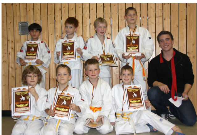
Unsere Kleinen bei den U11 Kreismeisterschaften mit ihrem stolzen Trainer.