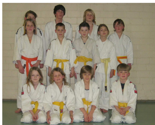
Gratulation an unsere Nachwuchsjudoka zur bestandenen Gürtelprüfung.